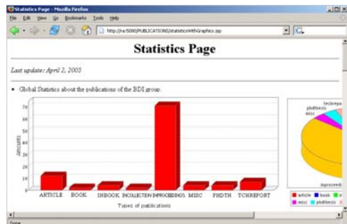
Figura 3: Estadísticas